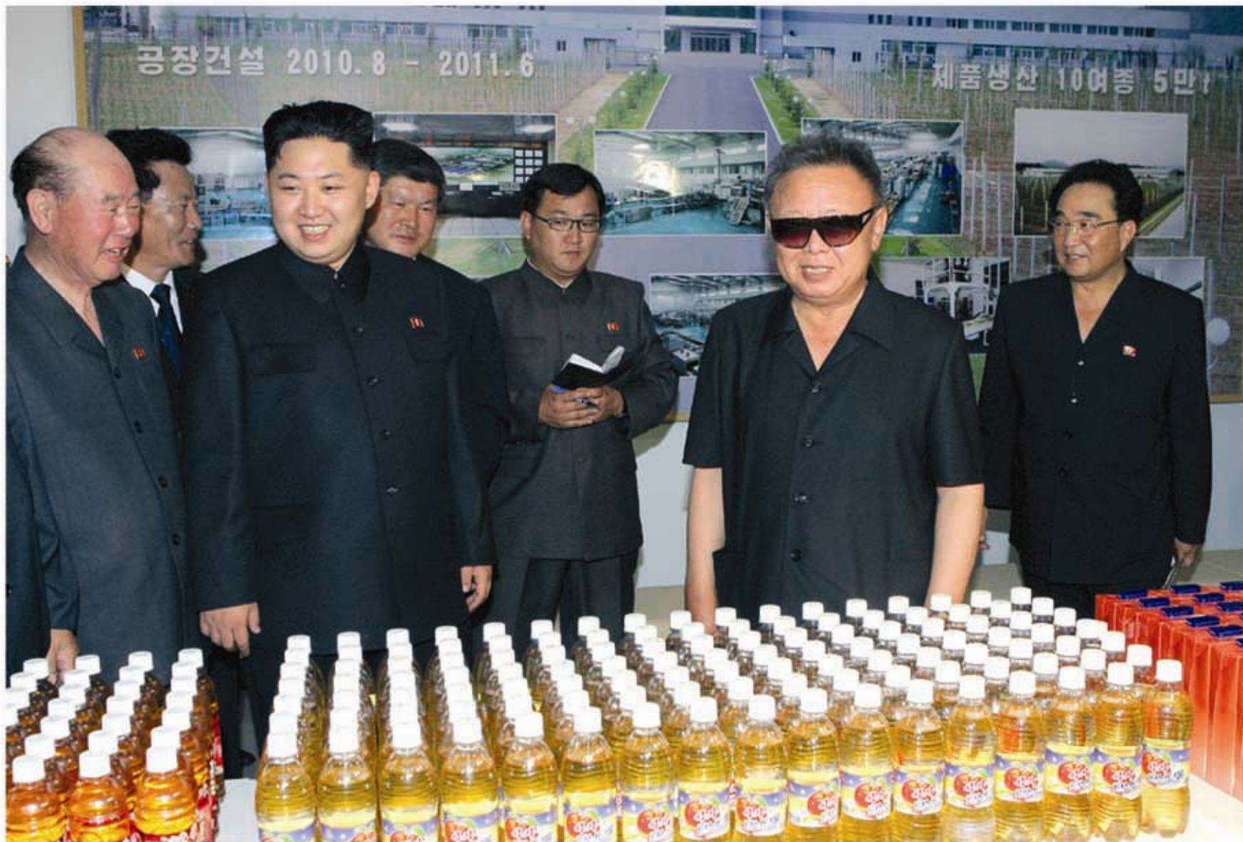
Ким Чен Ир и Ким Чен Ын в Тэдонганском плодоперерабатывающем комплексе (июль 2011 г.).