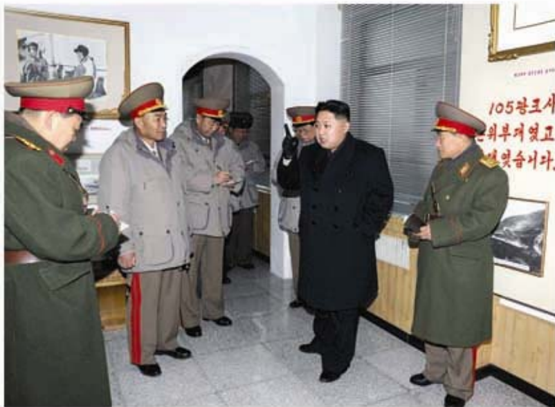
Верховный Главнокомандующий Ким Чен Ын в 105-й Сеульской гвардейской танковой дивизии КНА им. Рю Гён Су (январь 2012 г.).