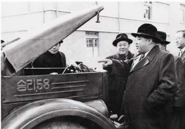
Ким Ир Сен осматривает первенец грузовика марки «Сынри – 58» (ноябрь 1958 г.).