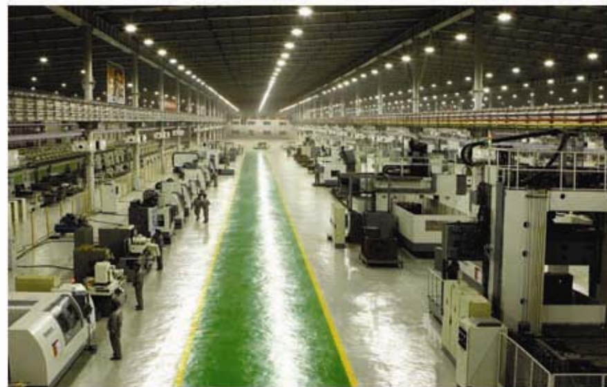
Хичхонский машиностроительный комбинат «Рёнха».