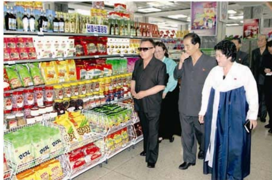
Ким Чен Ир на выставке товаров (июль 2011 г.).