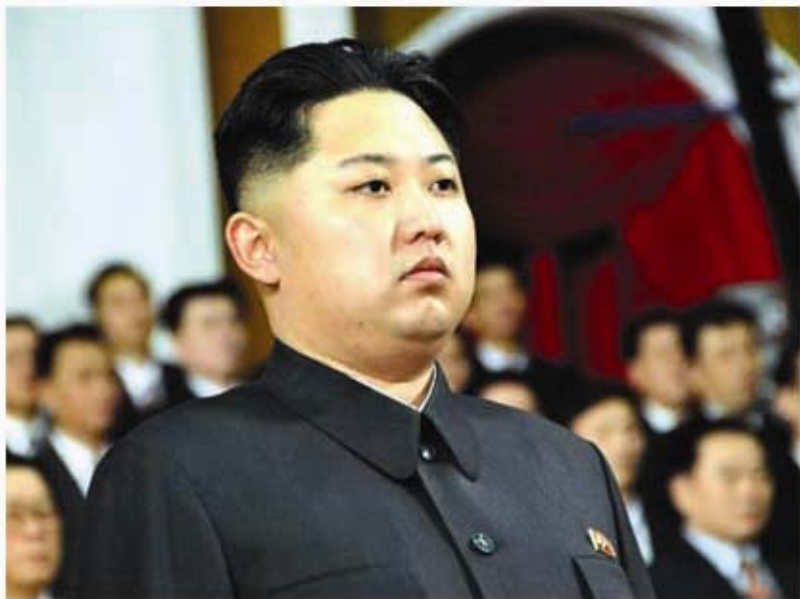
Уважаемый Ким Чен Ын.