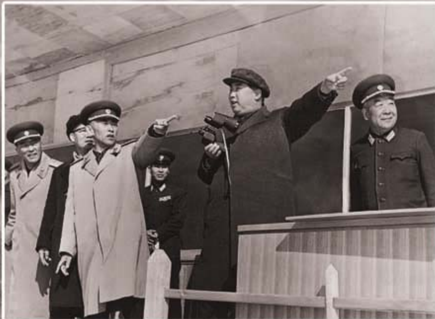
Ким Ир Сен руководит совместными военными маневрами соединений КНА (октябрь 1970 г.).