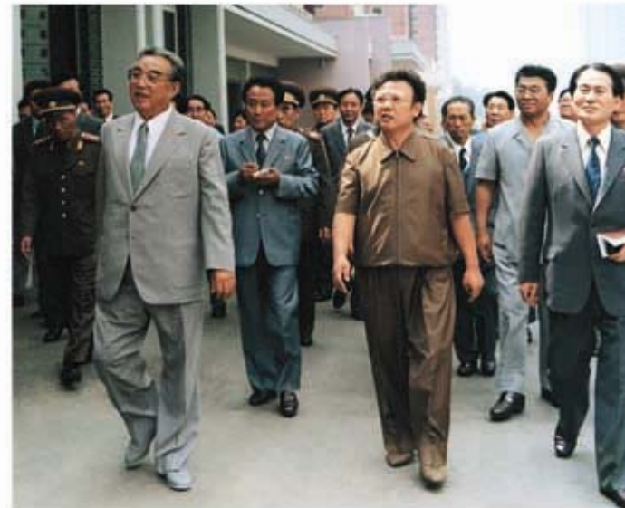
Ким Ир Сен и Ким Чен Ир осматривают жилые дома (август 1985 г.).