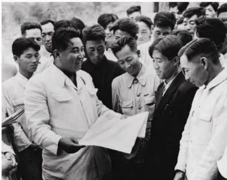
Ким Ир Сен среди рабочих (сентябрь 1959 г.).