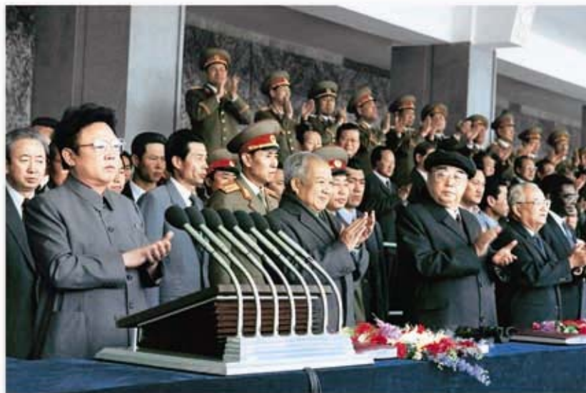
Ким Ир Сен и Ким Чен Ир на трибуне во время военного парада, посвященного 60-летию КНА (апрель 1992 г.).