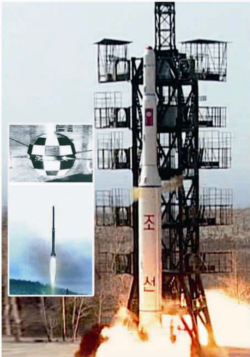
Запуск ИСЗ «Кванмёнсон – 1» и «Кванмёнсон – 2».