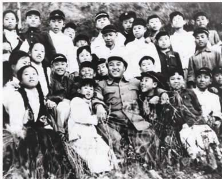
Ким Ир Сен среди учеников средней школы (октябрь 1957 г.).