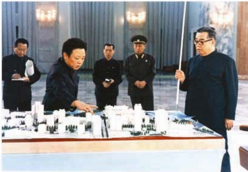
Ким Ир Сен и Ким Чен Ир перед макетом застройки улицы (апрель 1980 г.).