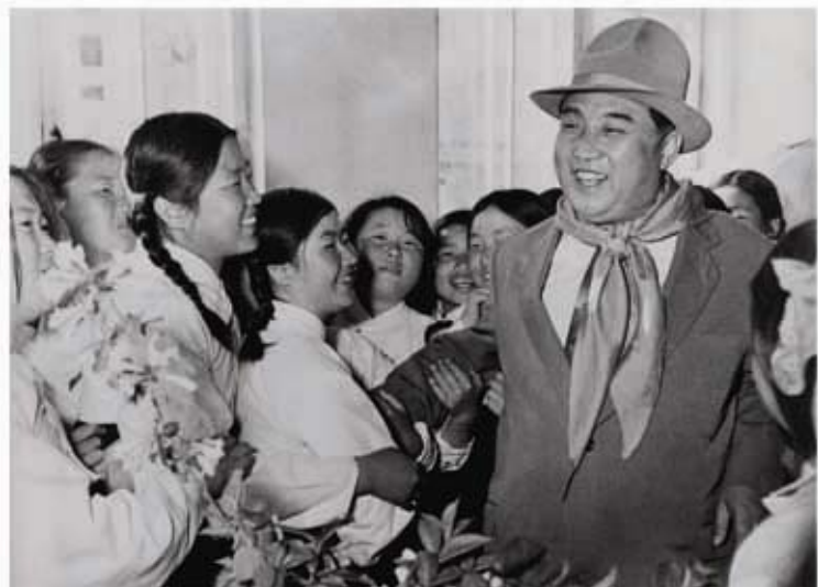
Ким Ир Сен среди воспитанниц училища для детей павших патриотов (май 1961 г.).